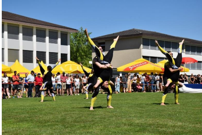
Die Kleinfeld-Gymnastiker/innen rockten das Feld