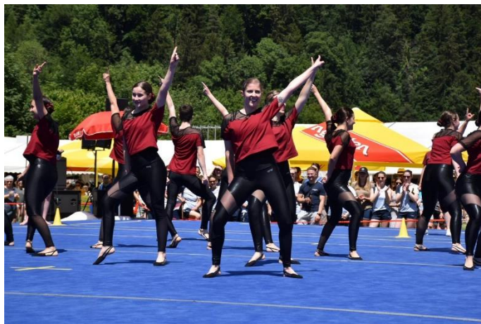
Die Turner/innen der Gymnastik Bühne zeigten ein abwechslungsreiches Programm